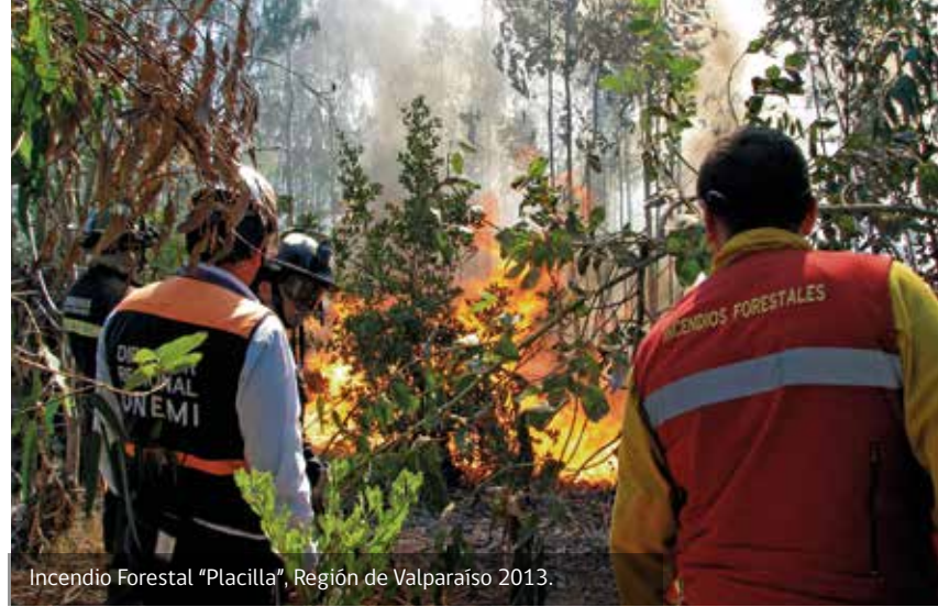
Incendio Forestal "Placilla", Región de Valparaíso 2013.