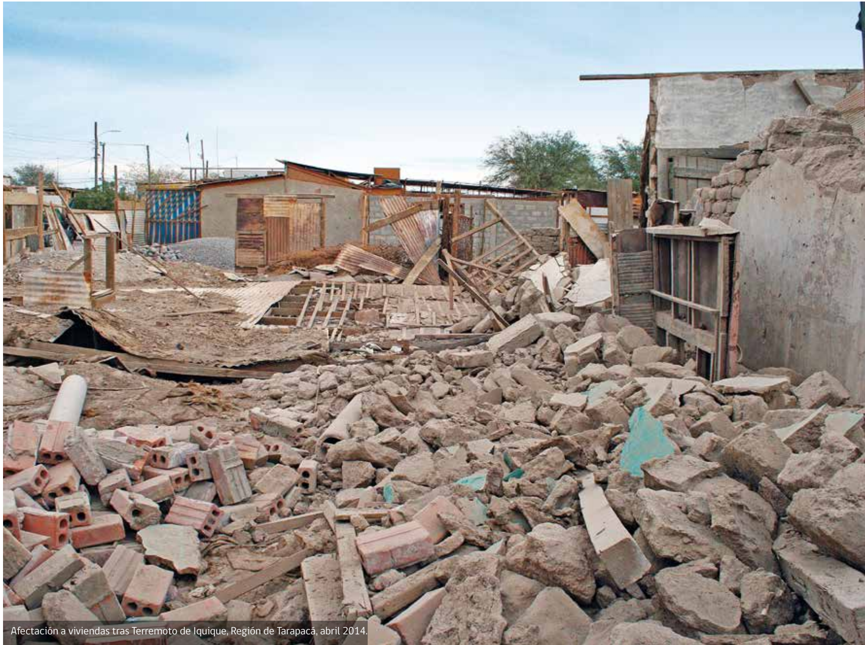
Afectación a viviendas tras Terremoto de Iquique, Región de Tarapacá, abril 2014.