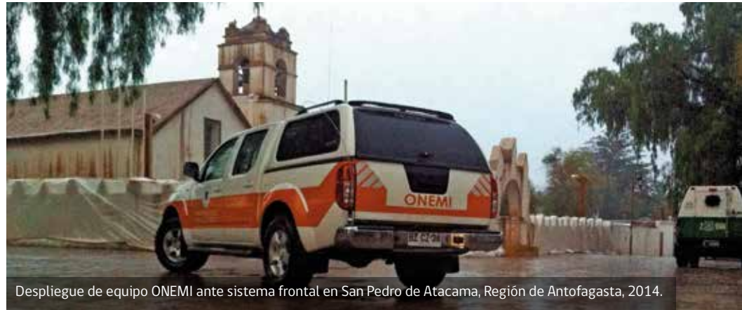
Despliegue de equipo ONEMI ante sistema frontal en San Pedro de Atacama, Región de Antofagasta, 2014.