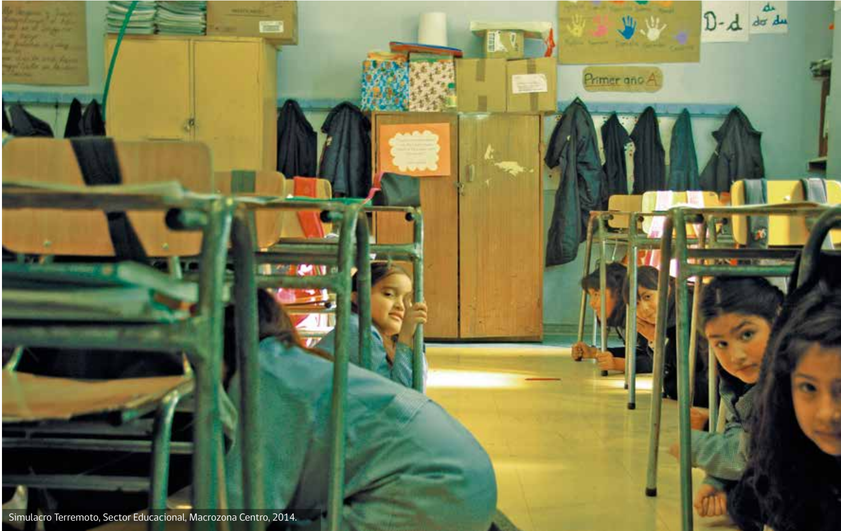
Simulacro Terremoto, Sector Educativo, Macrozona Centro, 2014.