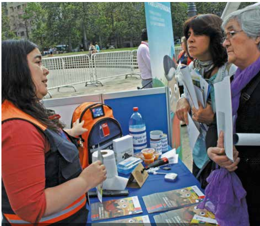
Presentación "Plan Familia Preparada", Plaza de la Constitución, diciembre 2015.

En lo que respecta específicamente a la dimensión regulatoria, junto con la legislación que institucionaliza al Plan Nacional de Protección Civil y al Sistema Nacional de Protección Civil,