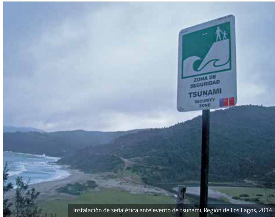
Instalación de señalética ante evento de tsunami, Región de Los Lagos, 2014.