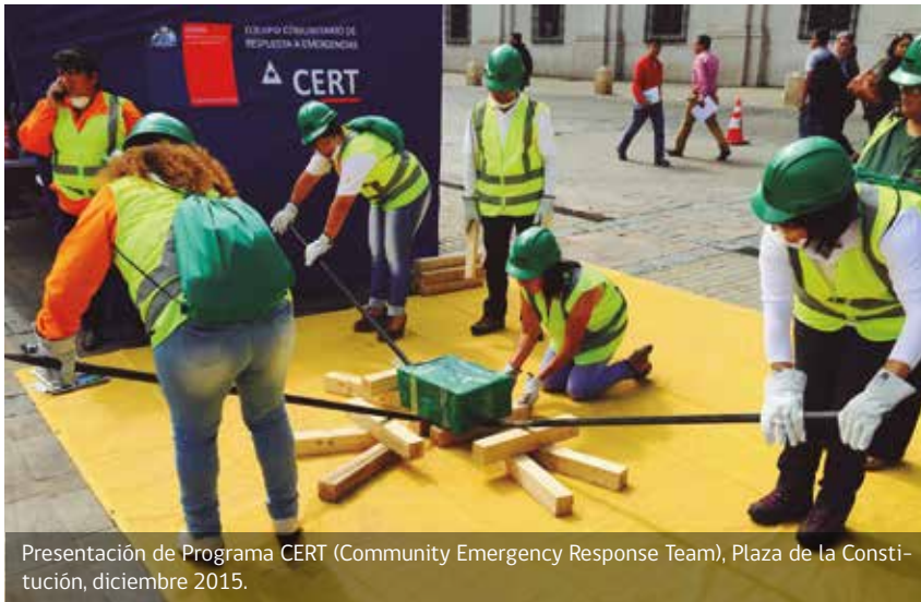
Presentación de Programa CERT (Community Emergency Response Team), Plaza de la Constitución, diciembre 2015.