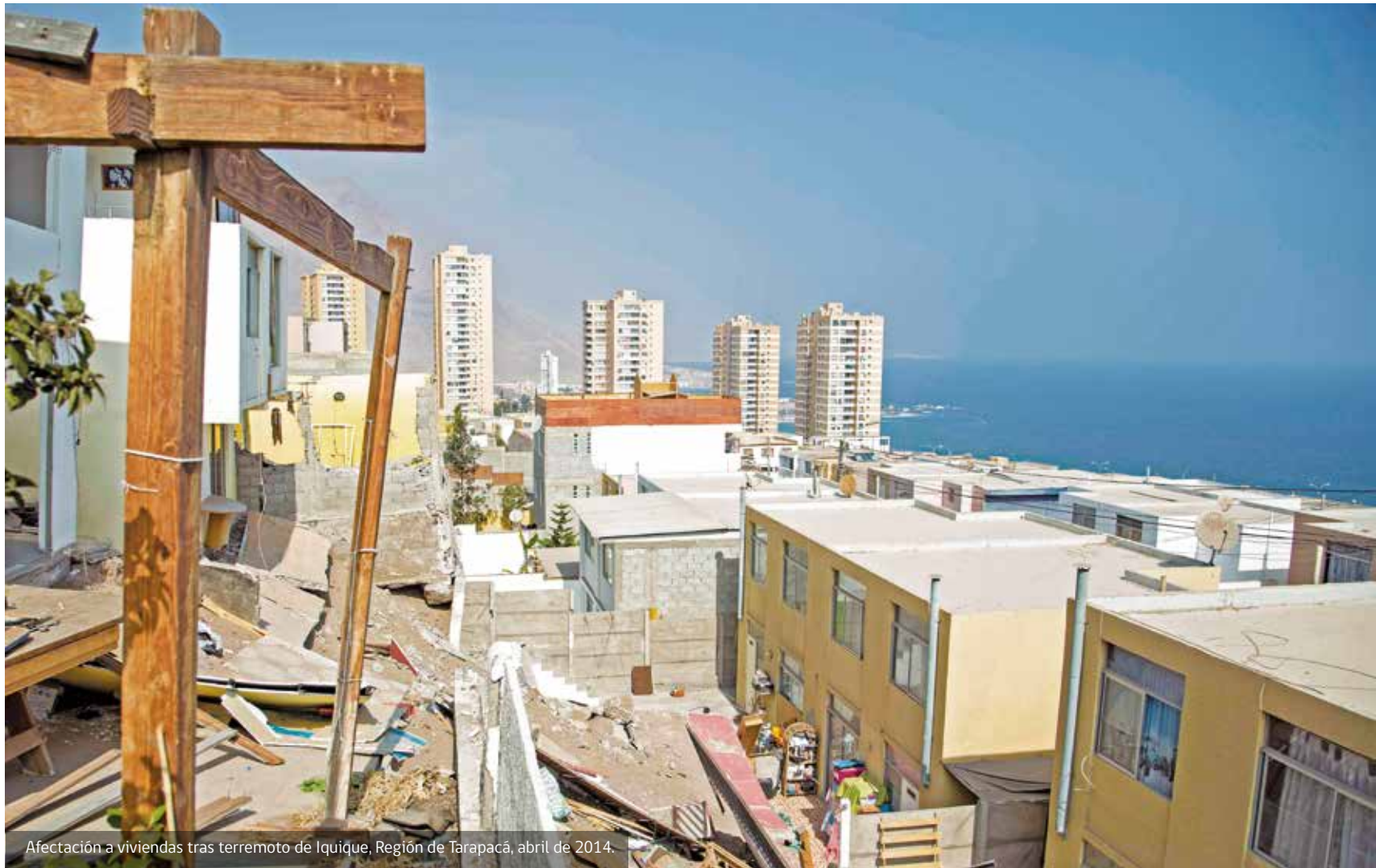
Afectación a viviendas tras terremoto de Iquique, Región de Tarapacá, abril de 2014.