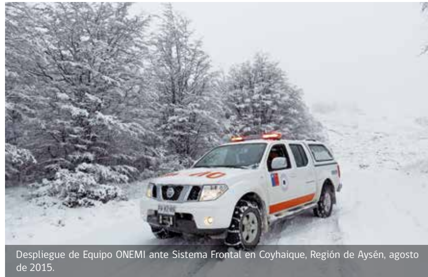
Despliegue de Equipo ONEMI ante Sistema Frontal en Coyhaique, Región de Aysén, agosto de 2015.