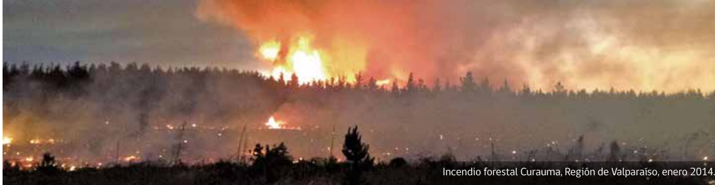
Incendio forestal Curauma, Región de Valparaíso, enero 2014.