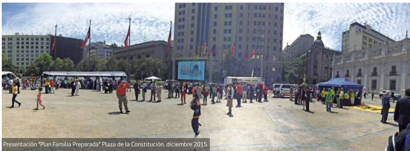
Presentación "Plan Familia Preparada" Plaza de la Constitución, diciembre 2015.

y simultáneamente sean viables en el corto plazo, así como sostenibles y fortalecidos en el mediano y largo plazo.