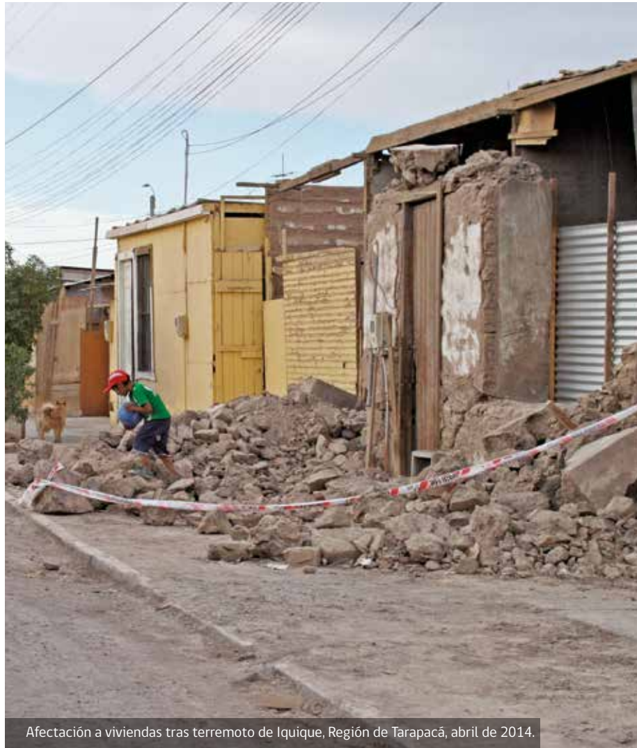
Afectación a viviendas tras terremoto de Iquique, Región de Tarapacá, abril de 2014.

Por otra parte, la discusión legislativa que propone un nuevo y fortalecido Sistema Nacional de Gestión del Riesgo y Emergencia y su respectivo Servicio, establecerá periodos de actualización de diferentes instrumentos de gestión, tanto sectoriales como territoriales. En el caso de la Política Nacional para la Gestión del Riesgo de Desastres, no deberá superar los 5 años. Así también los instrumentos de planificación en GRD que de ella deriven deberán someterse a un proceso permanente de revisión y actualización, acorde al contexto nacional e internacional en materias afines.