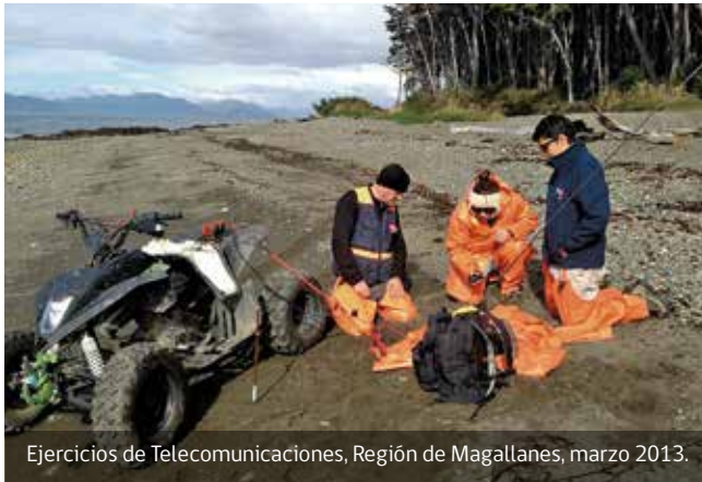
Ejercicios de Telecomunicaciones, Región de Magallanes, marzo 2013.