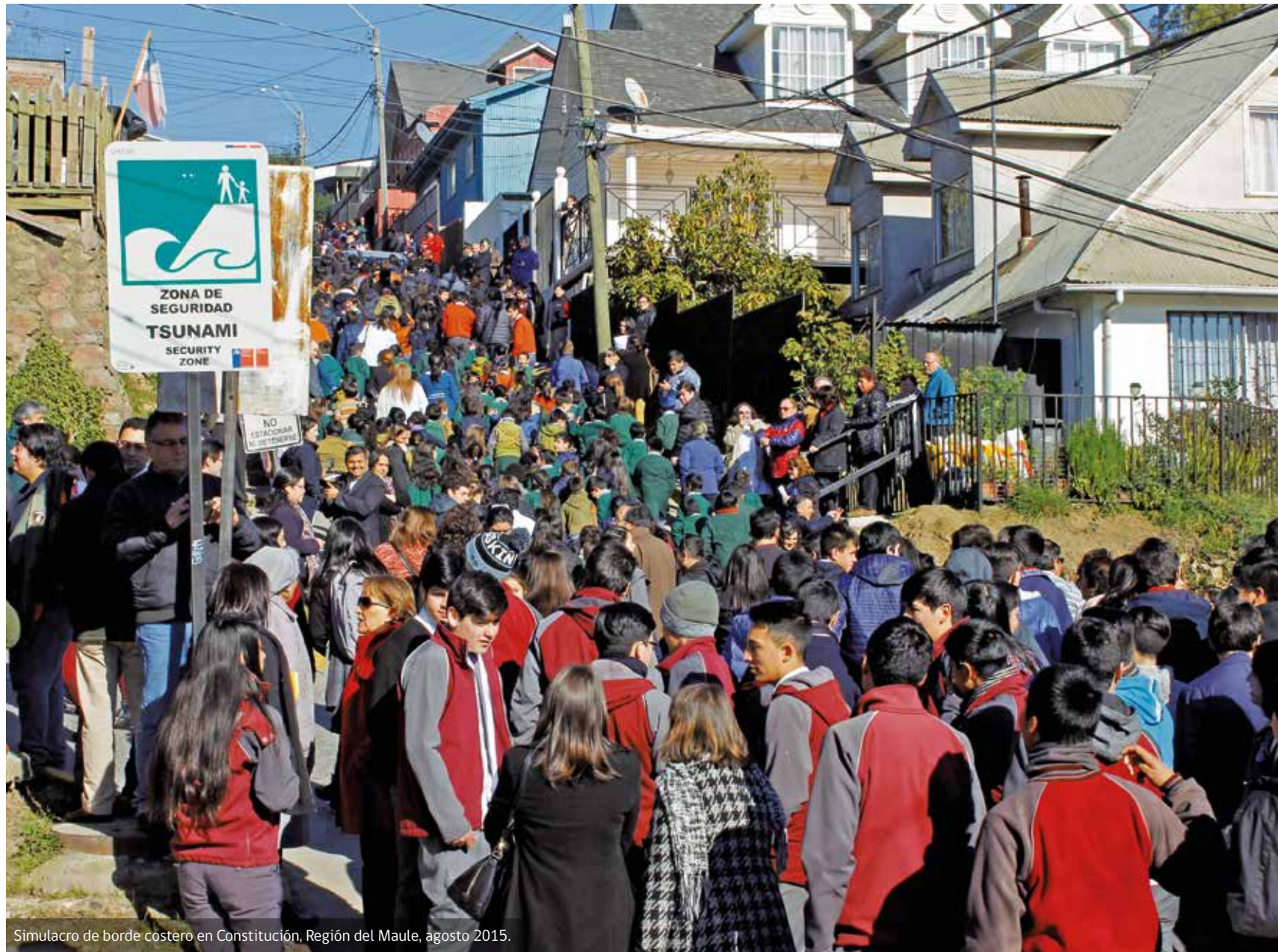
Simulacro de borde costero en Constitución, Región del Maule, agosto 2015.