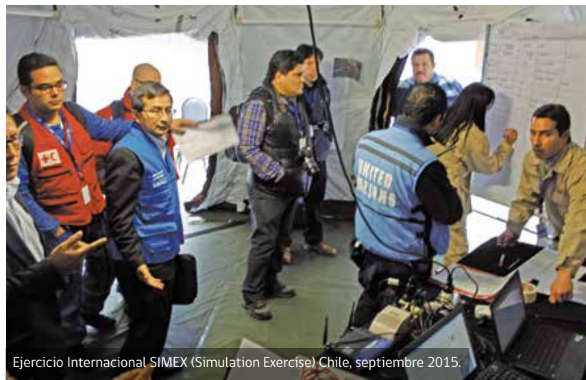
Ejercicio Internacional SIMEX (Simulation Exercise) Chile, septiembre 2015.