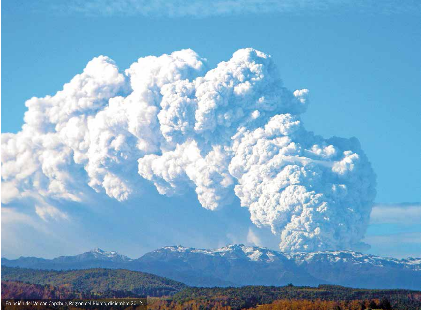
Erupción del Volcán Copahue, Región del Biobío, diciembre 2012.