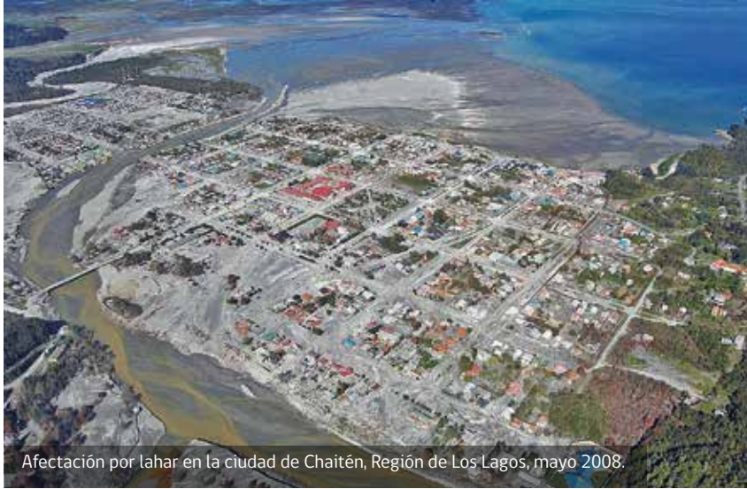
Afectación por lahar en la ciudad de Chaitén, Región de Los Lagos, mayo 2008.