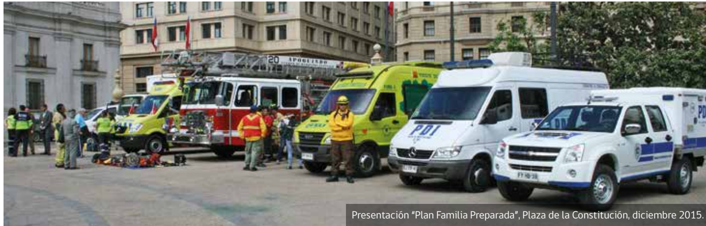
Presentación "Plan Familia Preparada", Plaza de la Constitución, diciembre 2015.

fortalecidas en los últimos años. Así también, se han instalado en el país y cobrado la debida relevancia, temáticas transversales como el enfoque de género, de personas en situación de discapacidad, infancia, entre otras.