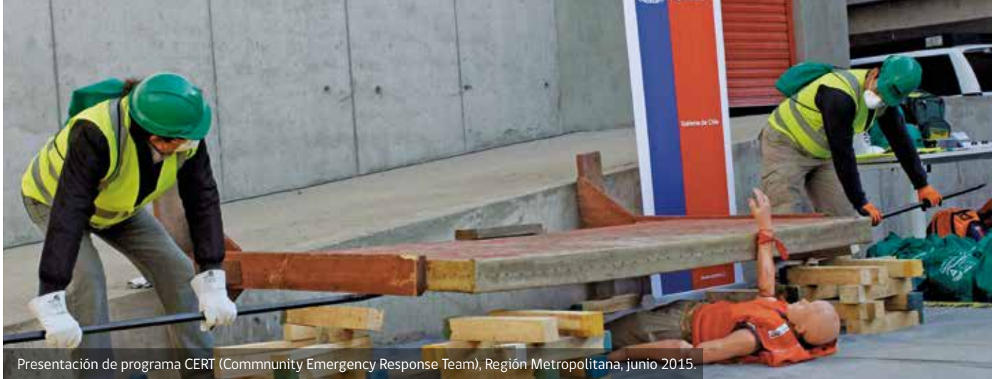
Presentación de programa CERT (Community Emergency Response Team), Región Metropolitana, junio 2015.