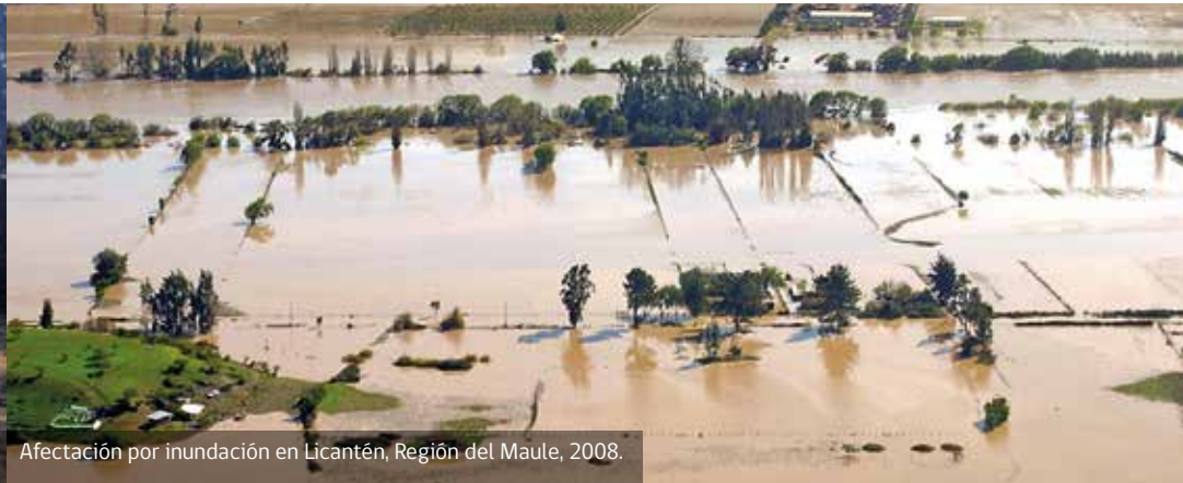
Afectación por inundación en Licantén, Región del Maule, 2008.