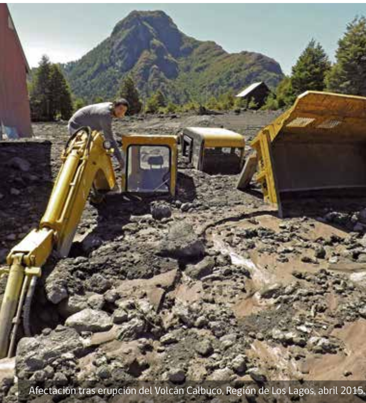
Afectación tras erupción del Volcán Calbuco, Región de Los Lagos, abril 2015.