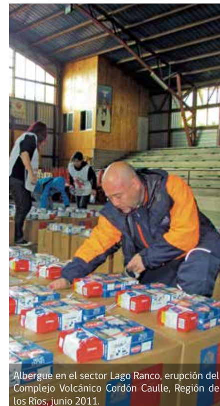
Albergue en el sector Lago Ranco, erupción del Complejo Volcánico Cordon Caulle, Región de los Ríos, junio 2011.