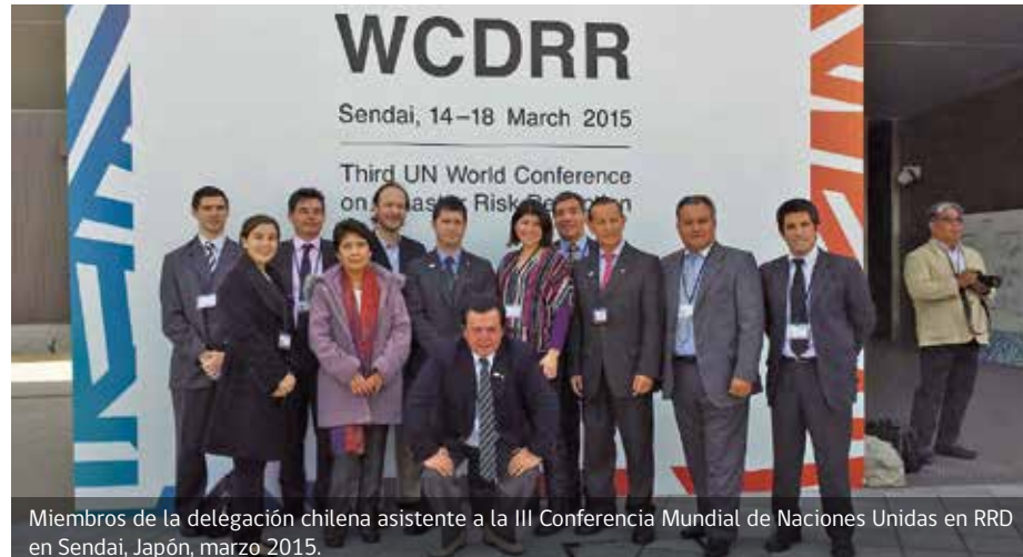
Miembros de la delegación chilena asistente a la III Conferencia Mundial de Naciones Unidas en RRD en Sendai, Japón, marzo 2015.