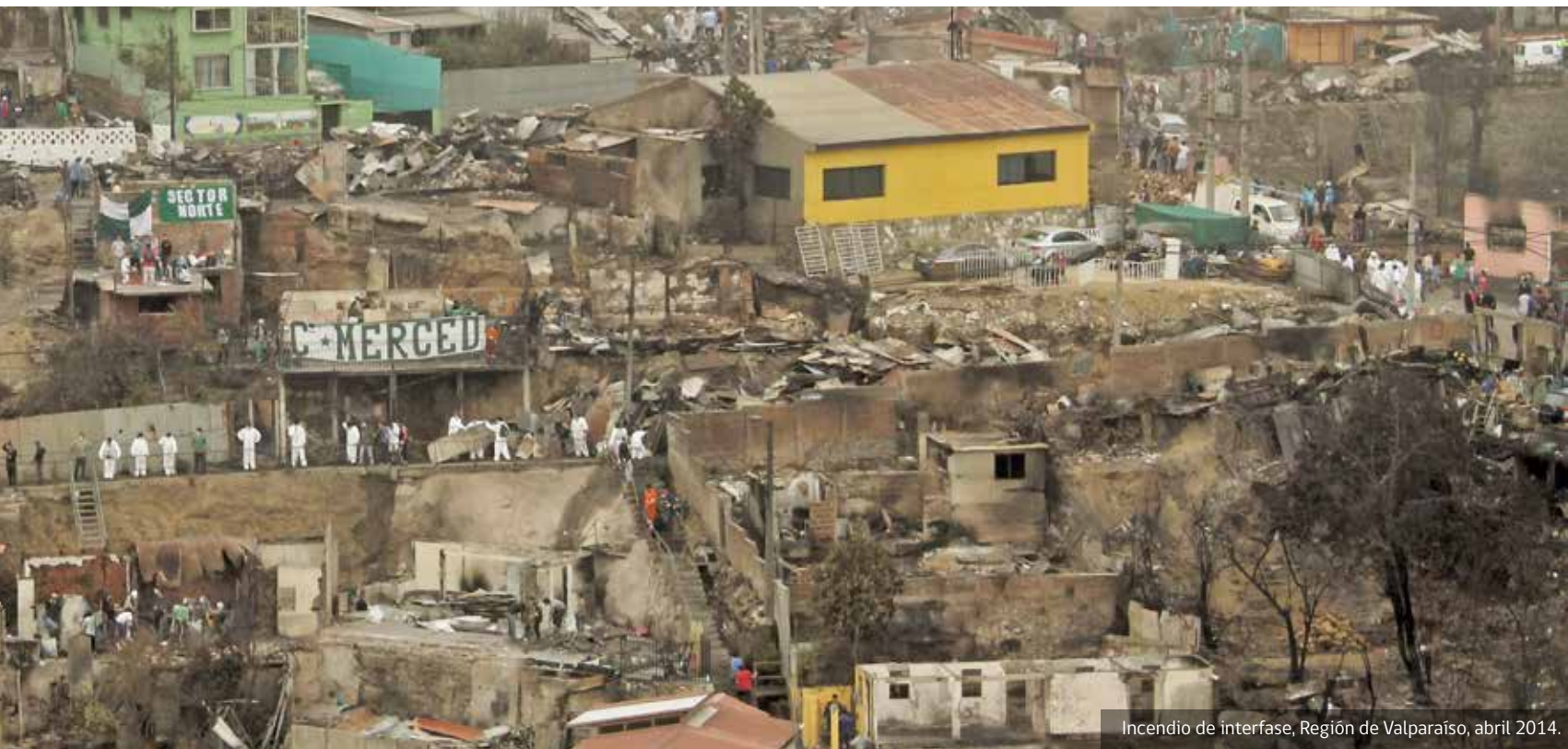
Incendio de interfase, Región de Valparaíso, abril 2014.