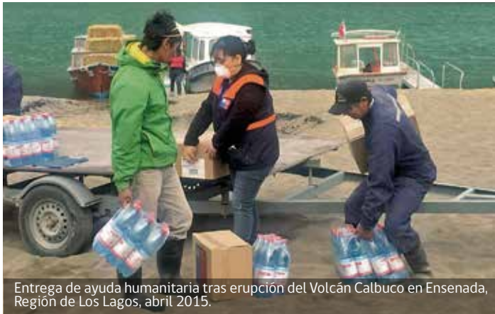
Entrega de ayuda humanitaria tras erupción del Volcán Calbuco en Ensenada, Región de Los Lagos, abril 2015.