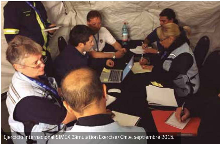
Ejercicio Internacional SIMEX (Simulation Exercise) Chile, septiembre 2015.