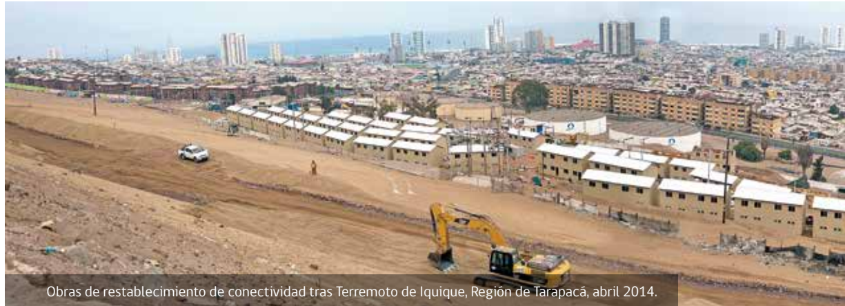
Obras de restablecimiento de conectividad tras Terremoto de Iquique, Región de Tarapacá, abril 2014.