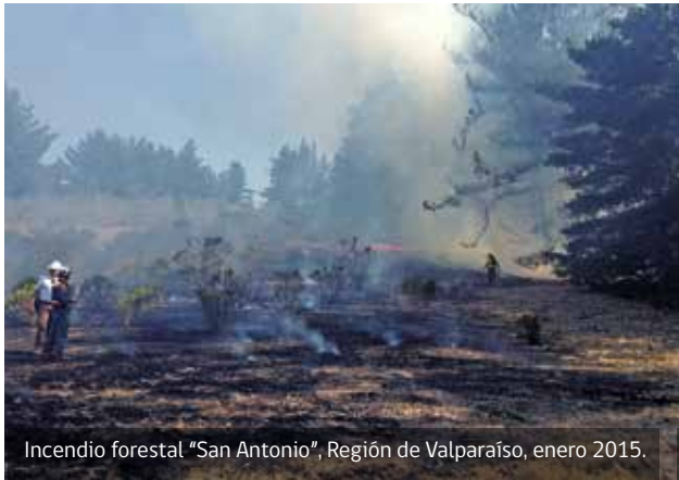
Incendio forestal "San Antonio", Región de Valparaíso, enero 2015.