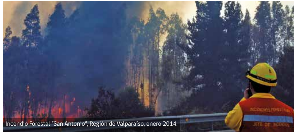
Incendio Forestal "San Antonio", Región de Valparaíso, enero 2014.