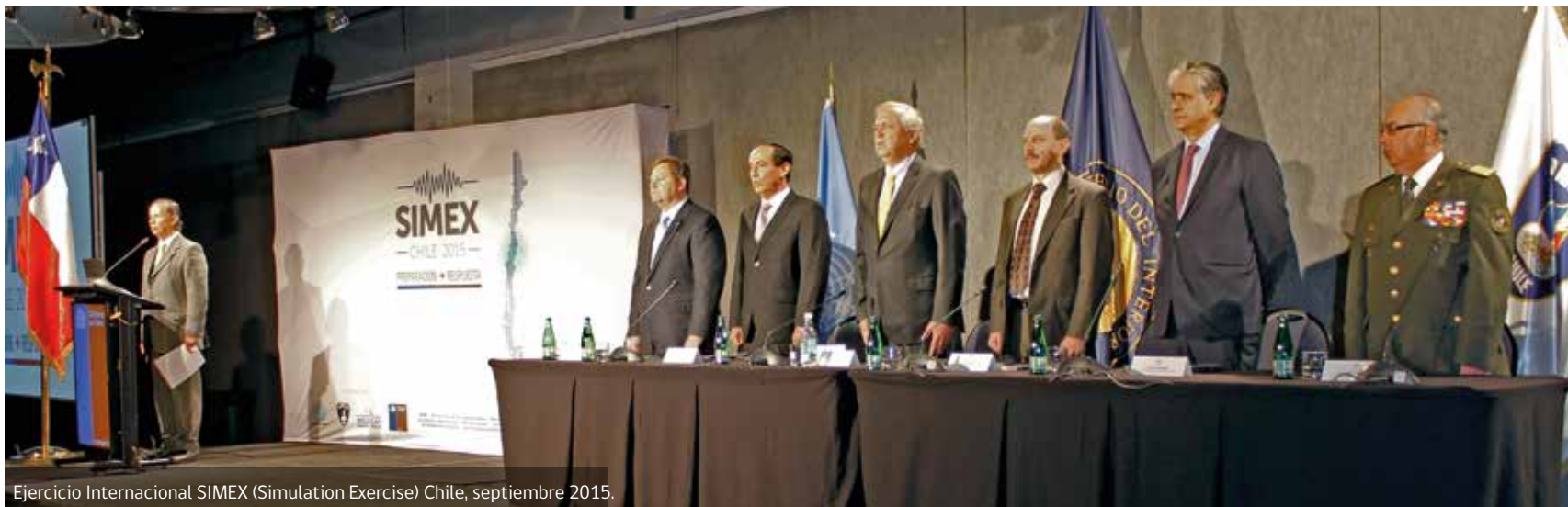
Ejercicio Internacional SIMEX (Simulation Exercise) Chile, septiembre 2015.