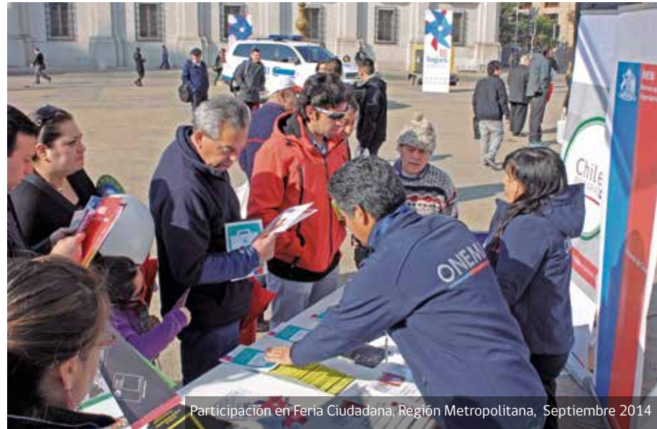
Participación en Feria Ciudadana, Región Metropolitana, Septiembre 2014

El presente PENG RD es el primer instrumento en la materia, que tiene como objetivo principal operativizar la vigente Política Nacional para la Gestión del Riesgo de Desastres, por lo que tanto su implementación como monitoreo se deben considerar como partes integrales de un esfuerzo que tiende a la mejora de las capacidades (técnicas, humanas, organizacionales, financieras) y el fortalecimiento